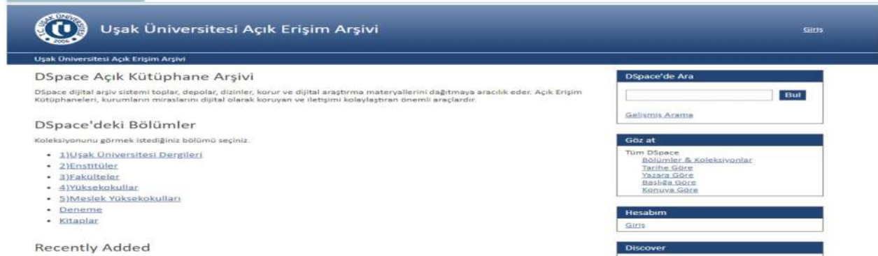
Şekil 1: Giriş Sayfası